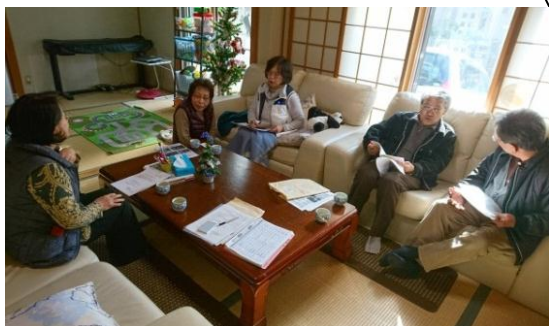
☆デイセンターわが家さんにて☆ 現在準備中♪♪

平成 30 年 3 月 18 日、吉野平区にサロンがオープンします！ 吉野平区にあるデイセンターわが家さんをお借りした地域と施設が繋がる居場所です。健康機材や楽器、お茶の間を利用した出入り自由な新しいかたちのサロンです。 地域住民の交流・親睦の場づくり、高齢者の閉じこもりや孤立防止、介護予防を目標に開催します。 多くの方に足を運んでもらいやすい、みんなに楽しんでもらえるよう、運営者の方々が話し合いを重ねておられます。 まもなくオープンです！おたのしみに～☆