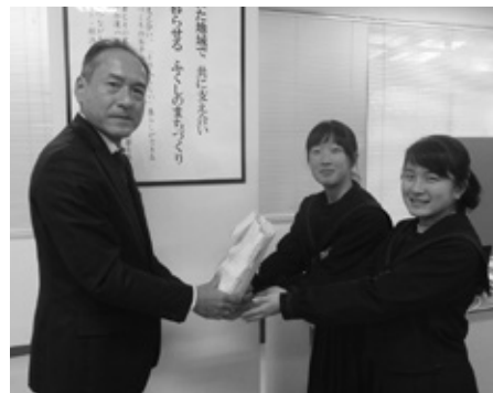
【大淀中学校の皆さまからの募金】