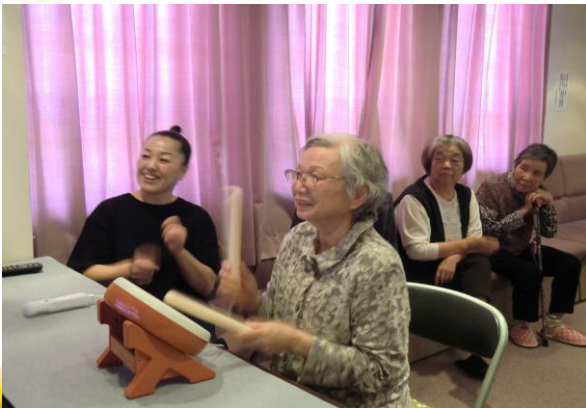
【ふれあいデイサービスレクリエーション】