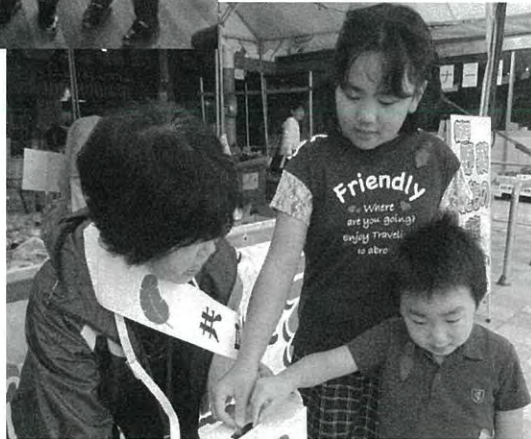
赤い羽根共同募金街頭募金▶