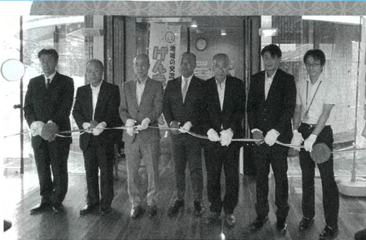
▲げんきかふえオープン