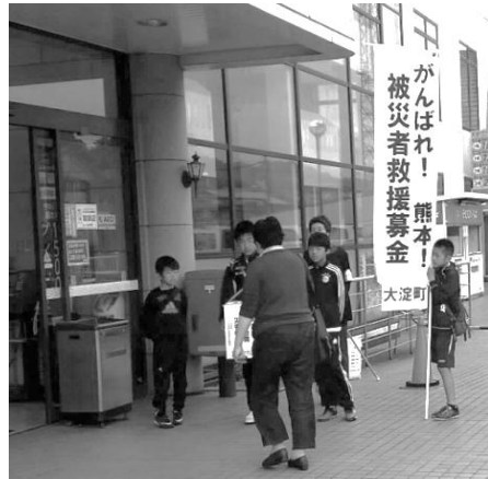
【街頭募金活動の様子】