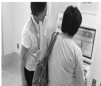
【病院ボランティア活動の様子】