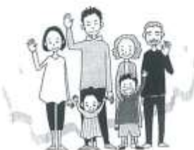
大淀町・大淀町社会福祉協議会 平成27年3月